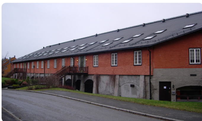
▲ Øvre Baklandet 1, tidligere Trondhjems Aktieteglverk, bygd om til selveierleiligheter i 1995

peratur, med dårligere uttørkingsmuligheter. Det frarådes å bruke innvendig etterisolering på teglvegger uten at teglsteinens frostbestandighet først er undersøkt. Å få til en god klemming av dampsperra er alltid en utfordring ved innvendig etterisolering. Mangelfull klemming gir luftlekkasjer til varmeisolasjonssjiktet og fare for kondensering mot murveggen.